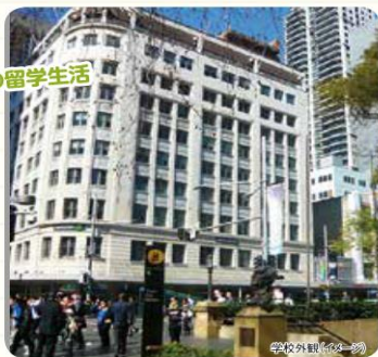
学校外観(イメージ)

オーストラリアで最も古く多国籍の人々が集まる国際都市シドニーは、70以上の美しいビーチ、象徴的な建造物等たくさんの観光名所がある人気の観光地です。シドニー校はビジネスの中心街にあり、タウンホール駅の前に位置しているため電車で移動も便利です。周辺には公園・カフェ・レストランがあるので、放課後も充実した生活を送る事が出来ます。