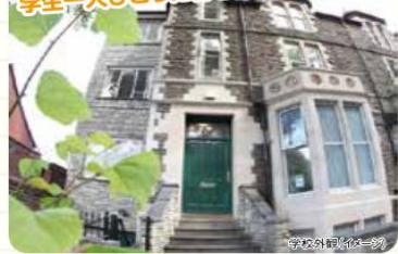
学校外観(イメージ)